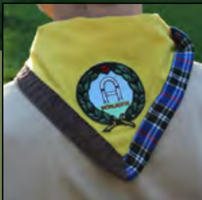
SCOUTING ASCANEN GROEP WWW.ASCANEN.NL