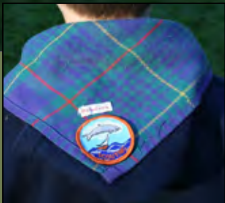
SCOUTING BRAMZIJGER WWW.BRAMZIJGER.NL