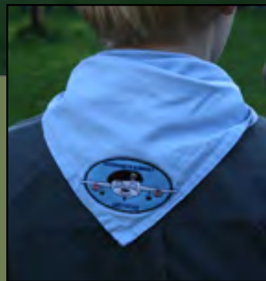
LUCHTSCOUTS VLIEGVELD LELYSTAD WWW.LUCHTSCOUTS LELYSTAD.NL